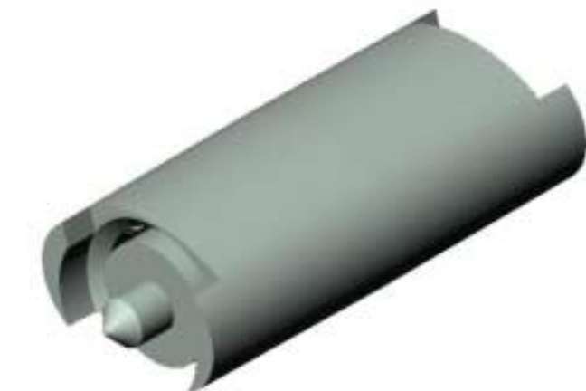
Figure 2. Metric magnet cap and standard cap.

Standaard blijft de Vantage Pro echter (helaas) geleverd met een 0,01 inch (=0,25 mm) regenmeter. Deze kan echter (bij de nieuwe modellen) vrij eenvoudig worden omgezet naar een 0,2 mm regenmeter. Daartoe wordt een extra gewichtje gemonteerd op de magneet bij het kantelmechanisme.. Haal de magneet los door de twee armpjes waartussen deze hangt licht uit elkaar te buigen. De magneet bestaat uit drie onderdelen: de magneet zelf en twee zwarte hulsjes die op de beide uiteinden van de magneet zijn geschoven. Schuif een van de twee zwarte hulsjes eraf. Steek nu de magneet met het blanke uiteinde in het nieuwe (grote) hulsje. Zie figuur 2 voor het resultaat. Plaats het geheel weer terug tussen de armpjes. Wij leveren dit op verzoek gratis mee bij de nieuwe modellen, die vanaf zomer 2003 geleverd worden.